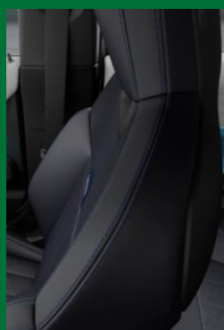
Vescin | Nightshade Blue