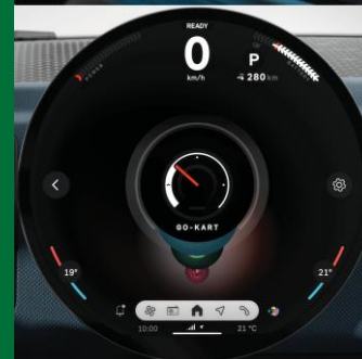
Pantalla Central OLED de diámetro 240 mm.