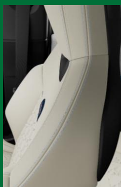
Vescin | Beige