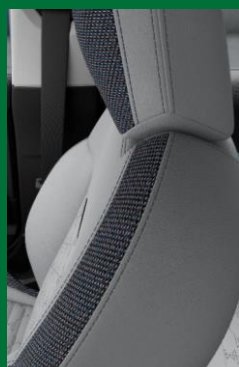
Combinación Vescin/cloth | Gris/Azul