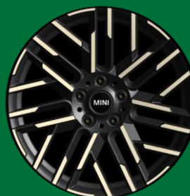
18" Night Flash Spoke bitono