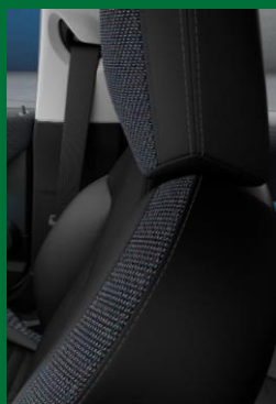
Combinación Vescin/cloth | Negro/Azul