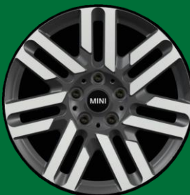
17" Paralle Spoke bitono